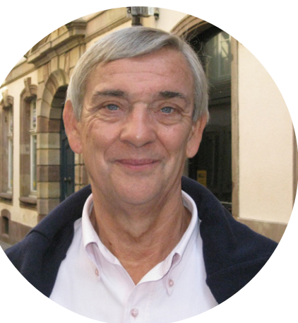
Président de l'ECAM Strasbourg-Europe

Bien sûr, ce rapprochement implique de trouver la meilleure manière de fonctionner tous ensemble, mais la confiance et l'envie sont là. Nous nous réjouissons d'incarner cette évolution dès septembre 2022 !"